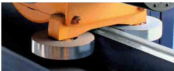
Styrullar på den övre ändvagnen mot kranbanans räl