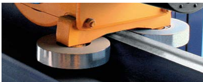
Styrrullar på den övre ändvagnen mot kranbanans räl