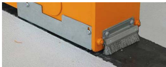
Hjul mot golv utan räls